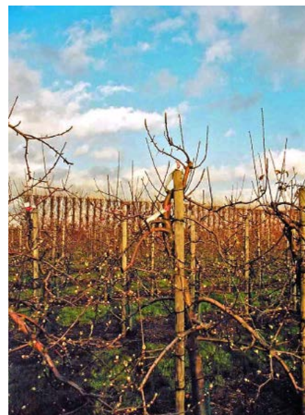
Regalis 2x behandeld

Met de nieuwe formulering van Regalis Plus hoeven telers zich minder druk te maken over de zuurgraad (pH) van het spuitwater. Door de ingebouwde waterconditioner en verzuurder wordt de actieve stof prohexadion onder minder gunstige omstandigheden beter door het blad opgenomen. Prohexadion kan alleen in opgeloste vorm door het bladweefsel worden opgenomen. Daarom is het belangrijk om Regalis Plus